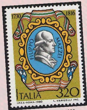
POSTE ITALIANE 1980 - 250° Anniversario nascita Filippo Mazzei

Incontri culturali e conviviali quotidiani a tema, visite guidate a monumenti come a cantine od aziende frantoi o dimore storiche esaltanti per una settimana i valori della nostra regione in un ponte ideale che ci unisce agli Stati Uniti di America in ricordo di un italiano che era la', a Filadelfia, accanto a Jefferson, Washington, Adams e Monroe il giorno della nascita degli Stati Uniti d'America portando il suo contributo di Patriot Remembered.