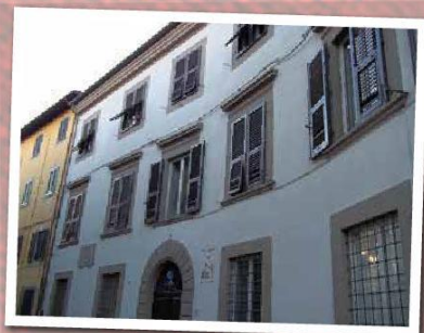
Casa di Filippo Mazzei dal 1792 al 1816 - Via Giordano Bruno 19 - Pisa