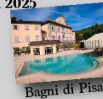
Bagni di Pisa