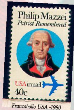
Francobollo USA -1980 Patriot Remembered